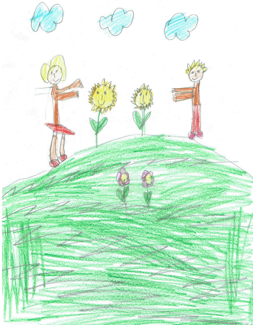
Ilustracija: Stela Vojvodić, 7.5 godina