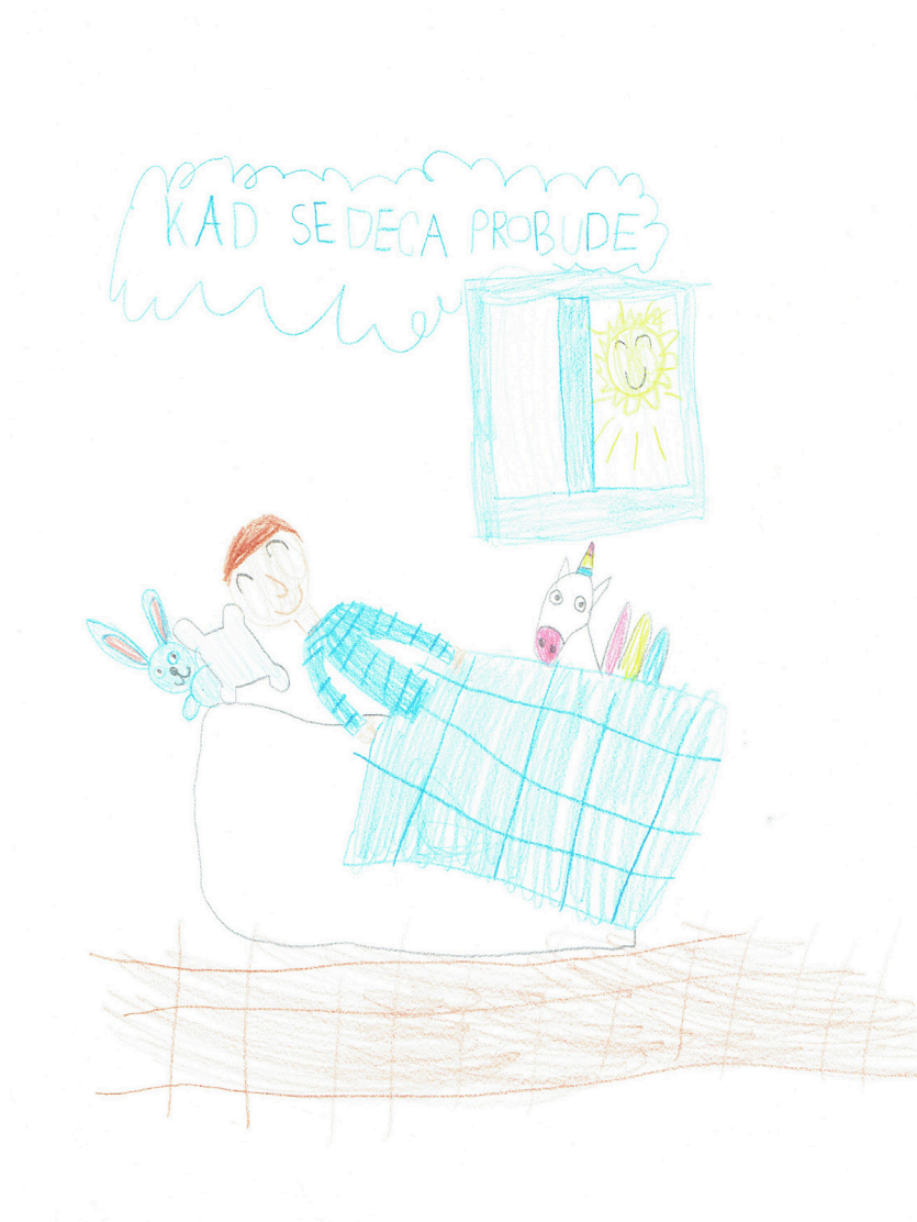
Ilustracija: Ksenija Prelević, 7.5 godina