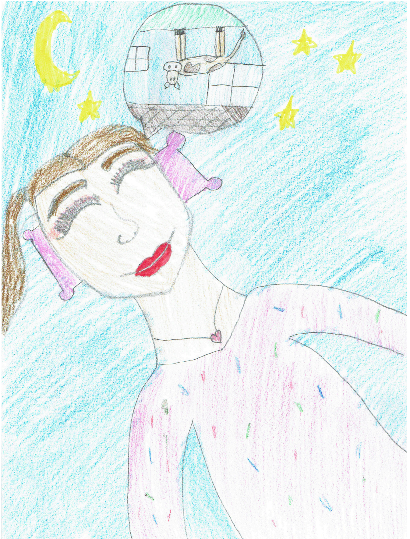
Ilustracija: Anja Mihailović, 9 godina