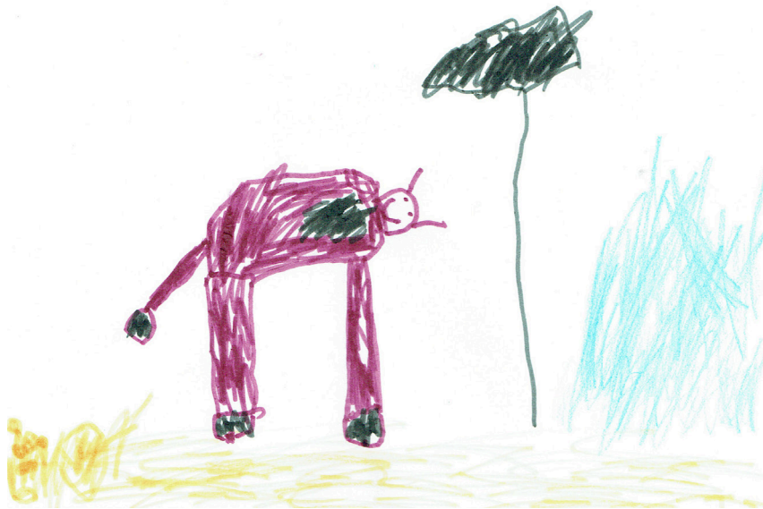
Ilustracija: Aleksa Vučković, 6.5 godina

Da li bi krava mogla da pase pijesak, Sunce i talase? Pa kad upeče Sunce vrelo, da li bi mlijeko pocrnjelo?