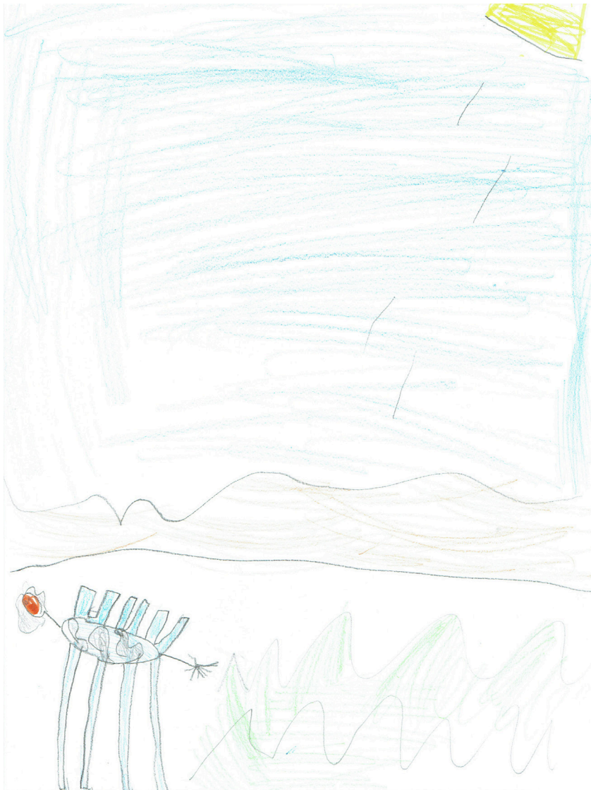
Ilustracija: Filip Šćepanović, 6.5 godina