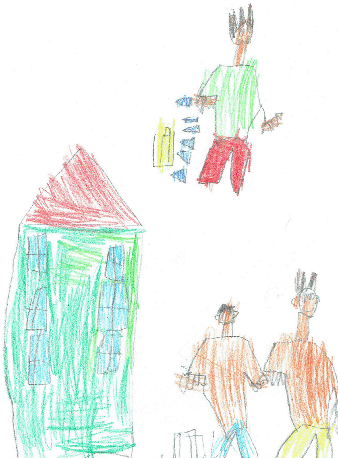
Ilustracija: Ognjen Mitrović, 6,5 godina